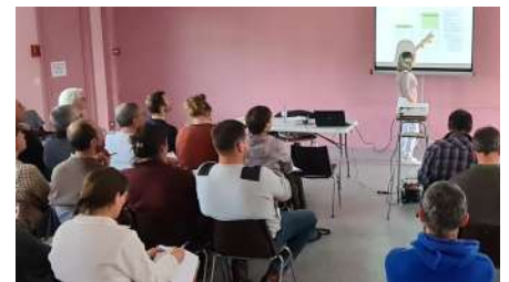
Réunion d'information PAC avril 2023

En plus de cela, nous prévoyons d'organiser une session collective d'accompagnement à la déclaration PAC. Si vous êtes intéressés, inscrivez-vous auprès d'Adrien.