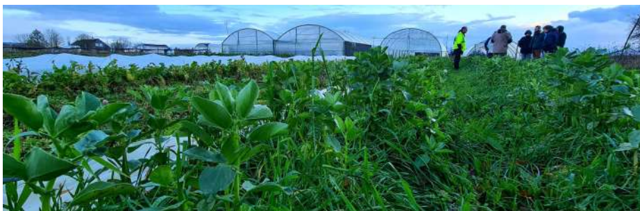
Exemple de couvert en maraîchage

Maîtrise des adventices, prévention des bioagresseurs, lutte contre l'érosion des sols... Les couverts végétaux sont pleins de promesses. Mais comment s'y prendre pour faire son mélange ? Quelles espèces choisir ? Quelle quantité semer ? Cet article vous livre quelques pistes.