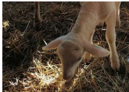
Agneau de la nouvelle saison

Cette année, les naissances arrivent de bonne heure. Benoit a surveillé onze mamans brebis sur une seule et même journée début janvier. Cela annonce le retour de l'activité. Les voici de nouveau dans un rythme très soutenu jusqu'en juillet, puis seulement soutenu jusqu'à fin septembre. Début août, ils allègent le planning en produisant uniquement de la tomme, dont ils confient la fabrication à leur salariée Alice, afin de réussir à partir un peu en vacances.