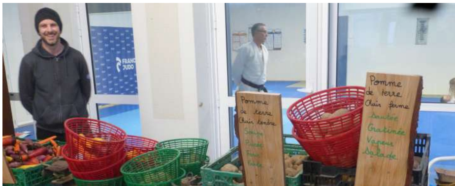
Distribution à l'AMAP de la Membrolle s/Longuenée Grâce aux animations organisée par l'association, 15 nouveaux adhérents

La baisse de l'offre se poursuit. Entre novembre 2022 et octobre 2023, l'offre