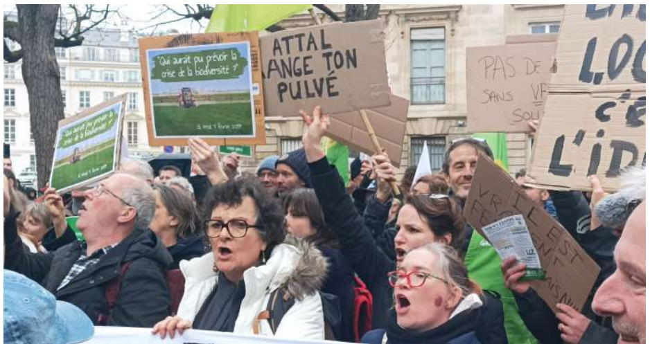
Manifestation des producteurs et productrices du réseau FNAB à Paris, le 7 février